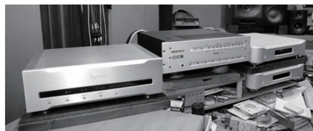
鉦合金時脈產生器 G-0Rb(左邊) 一組D/A單聲道轉換器D-01(右邊)

重新灌製唱片的標準是忠實的捕捉原有母帶的品質。ESOTERIC旗艦級D/A轉換器 D-01VU、鉦合金時脈產生器 G-0Rb以及ESOTERIC MEXCEL線材，皆在重新灌製步驟使用。先進技術的結合完全捕捉原廠母帶的音質。